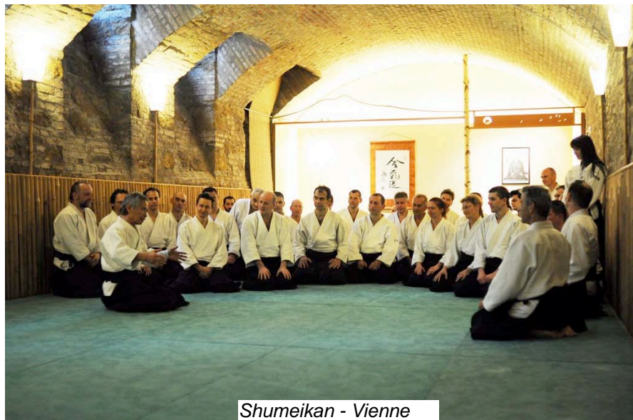
Shumeïkan - Vienne